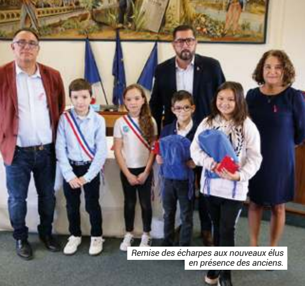
Remise des écharpes aux nouveaux élus en présence des anciens.