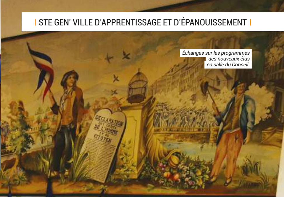
Échanges sur les programmes des nouveaux élus en salle du Conseil.