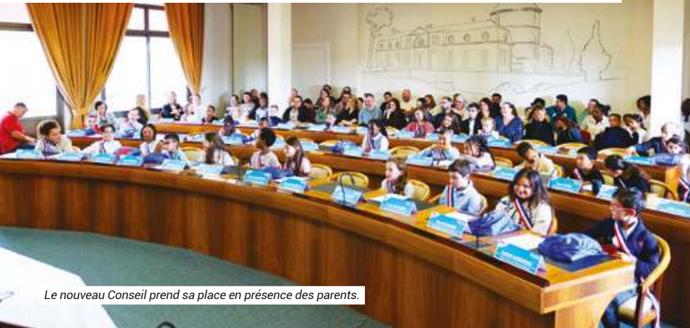
Le nouveau Conseil prend sa place en présence des parents.

Les jeunes élus sont déjà très impliqués et viennent en nombre une semaine sur deux aux réunions du mercredi matin. Ils ont à cœur de représenter leurs camarades et défendre leurs idées. Nous travaillons sur le projet du "Banc de l'Amitié" pour lutter contre l'isolement des enfants dans les cours d'écoles, participons au Bus de Noël, l'opération de collecte de jouets et réfléchissons ensemble à de nouveaux projets.