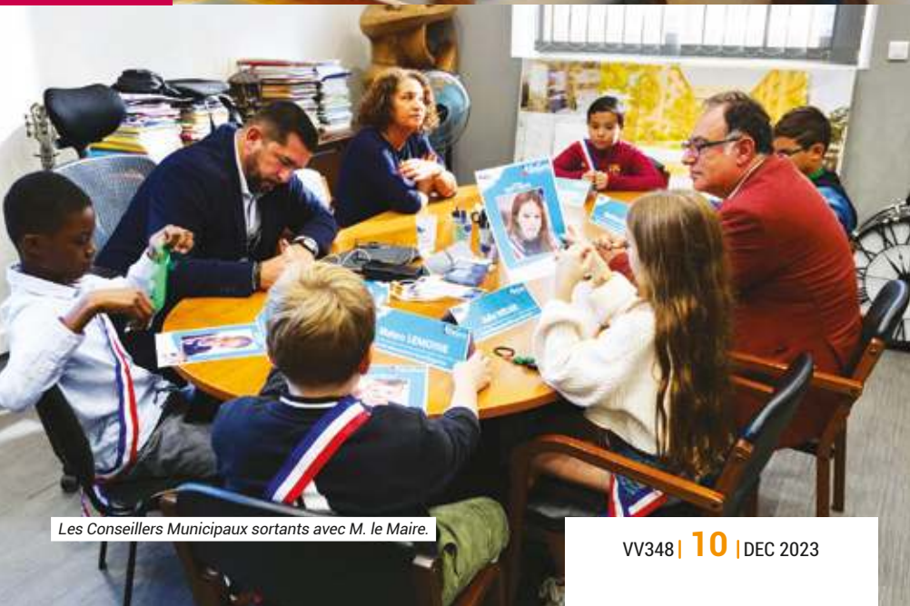
Les Conseillers Municipaux sortants avec M. le Maire.